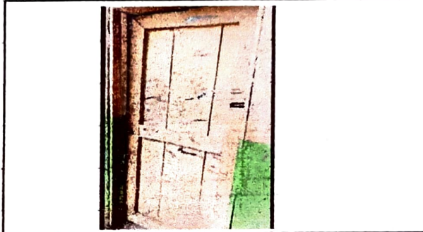
Foto 2: Se necesita de 1 puerta de metal de 1.60m X 1m de un aula.