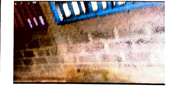
Foto 6: Se necesita repellar dentro y afuera de cada uno de los 12 aulas incluyendo la Dirección.

Observación: Si es necesario se pueden agregar hojas adicionales y actualizar el número de hojas.