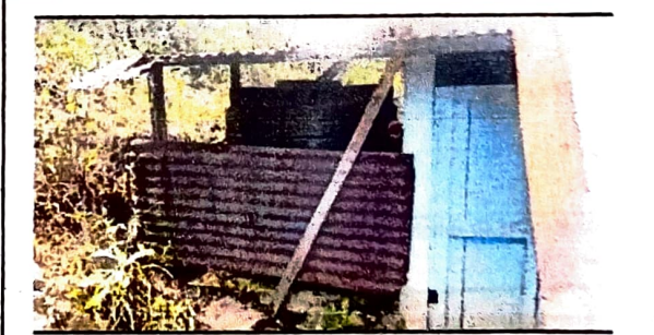
Foto 4: Se necesita 4 puerta de baño de inodoro y cambio de dos tinacos de 2700 litros.